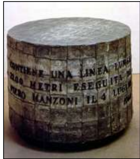
Línea m. 7200, 4 de julio de 1960 (66 x 96 cm.)