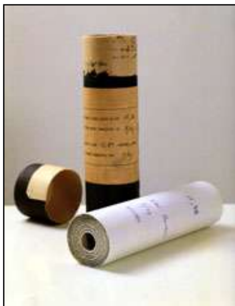
Línea m. 15,80, septiembre de 1959. Tinta sobre papel, cartón (21 x 6 cm)