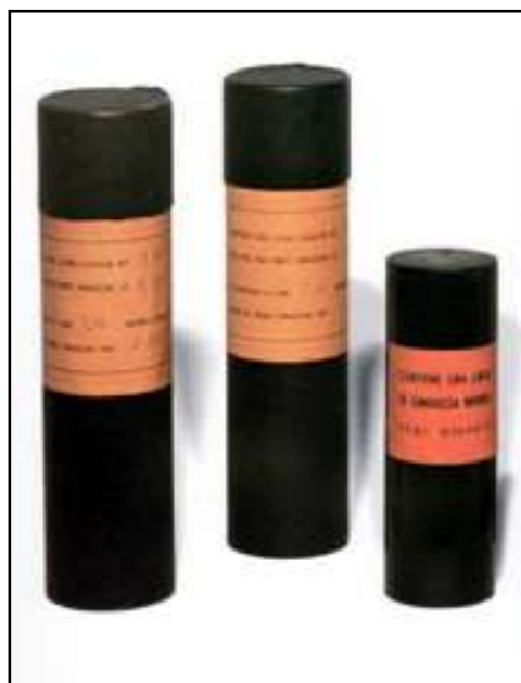
Línea m. 3,10, noviembre de 1959. Línea m. 11,65, diciembre de 1959. Línea de Largo infinita 1960, madera (15 x 48 cm.)